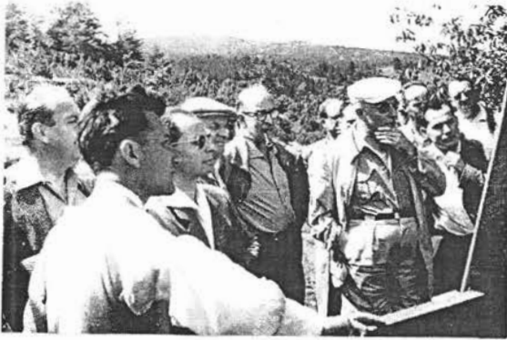
34 MONTNER (PO)1960