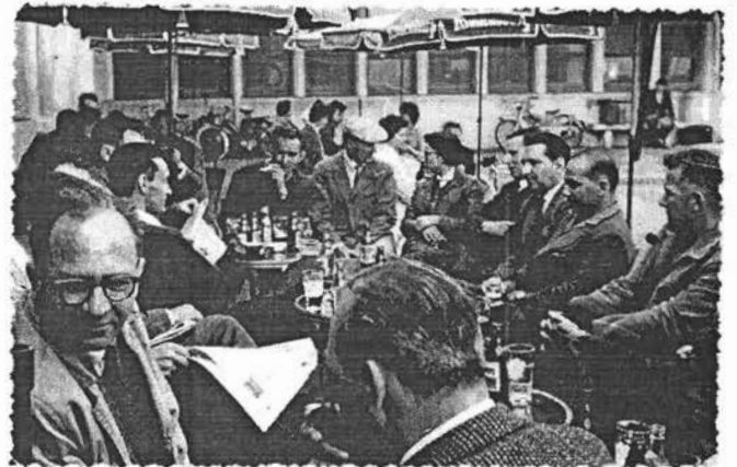
TOURNEE MACONNAISE (1961 39