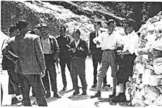
33 MONTNER (PO)1960