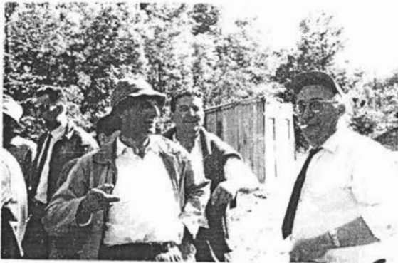
35 MONTNER (PO) 1960