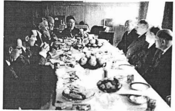
MINISTERE SOVIETIQUE1960 38