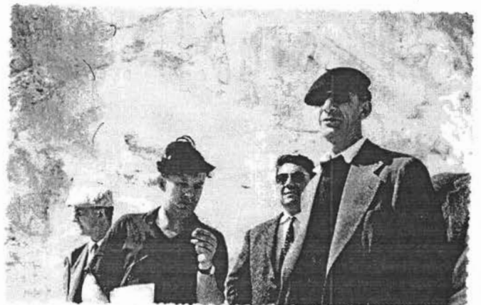
MONTEBRAS 1961 40