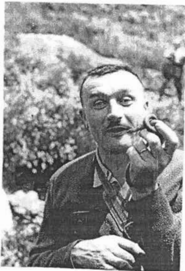
36 LE CHARMEUR DE SERPENT 1960