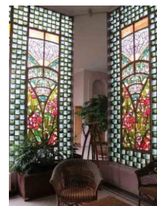
Art Nouveau et Ecole de Nancy

Réunion /repas avec anciens et actifs volontaires du brgm