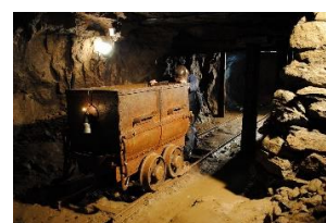
Mine de Sel à Varangéville avec repas au fond ( -160m)